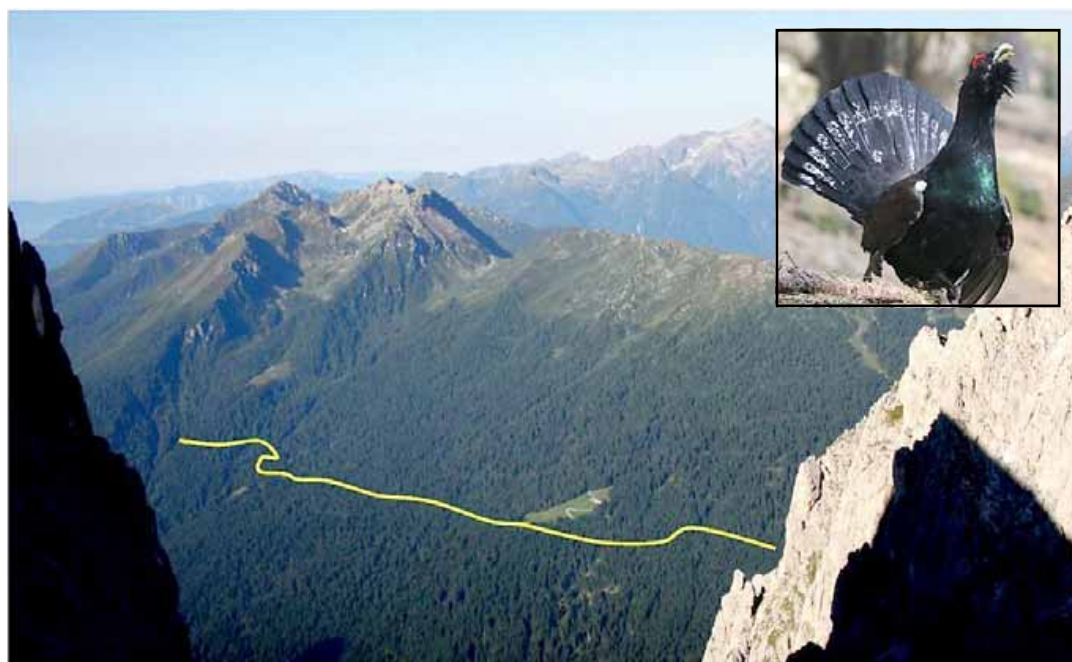
• Qui sopra la strada già esistente che corre a 1500 metri, sotto la zona cedrone. Al centro: in alto la ruspa al lavoro, in basso la nuova strada in rosso, in giallo la vecchia. A destra in alto il progetto gennaio 2019, in basso giugno 2019

TRENTO. Prima le interrogazioni urgenti in consiglio provinciale, poi le prese di posizione delle associazioni ambientaliste del Trentino, di tutte, grandi e piccole. Ieri una delle più attese, quella della Sat, che ripartiamo per intero nella pagina a fianco per ciò che la Sat rappresenta nella società e nella cultura trentina e per il respiro dell'analisi. Il tema, urgente e spinoso, è quello dell'abuso delle decretazioni d'urgenza post-Vaia per realizzare una strada forestale tra malga Crel e malga Scanaiol, in val Cismon, in pieno Parco naturale di Paneveggio-Pale di San Martino, che rischia di distruggere una delle più importanti arene di canto del gallo cedrone delle Alpi Orientali. Si tratta di un sito ben noto ai ricercatori che in Europa si occupano di tetraonidi e che per molti versi rappresenta un unicum, anche perché si trova al centro di un habitat ad altissima vocazionalità per la specie. Ciò detto, siamo ancora nella fase della "moral suasion", con la speranza di ripensamento dell'intero progetto da parte dell'amministrazione provinciale, ma il tempo per intervenire oramai è agli sgoccioli visto che le ruspe si trovano già ben oltre malga Crel. Per inquadrare meglio la questione è utile però fare un passo indietro e mettere a fuoco alcuni passaggi chiave dell'iter procedurale, evidenziandone le zone d'ombra. Partiamo dal progetto, che ha subito una correzione in corsa. Nel primo scialcio del Piano d'azione per la gestione degli interventi di